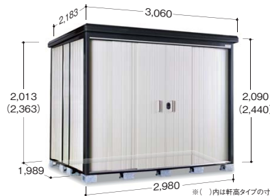
※( )内は軒高タイプの寸法です ※写真は軒高タイプです