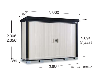
※( )内は軒高タイプの寸法です ※写真は標準タイプです