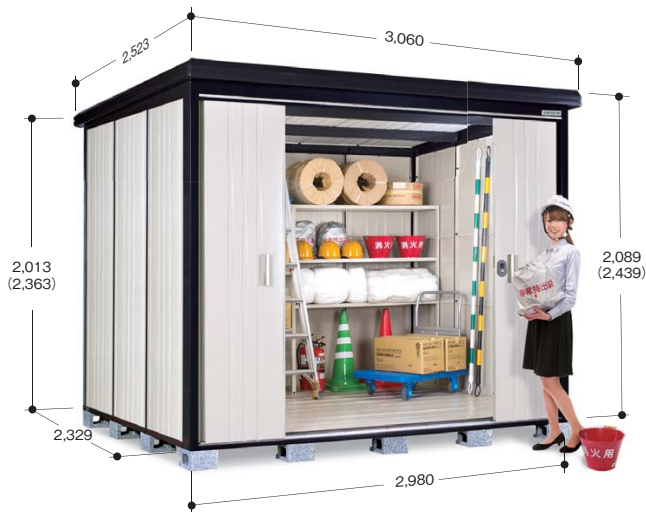
※( )内は軒高タイプの寸法です ※写真は軒高タイプです