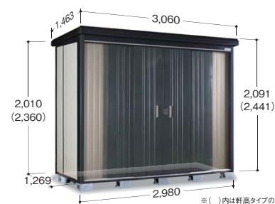
※( )内は軒高タイプの寸法です ※写真は軒高タイプです