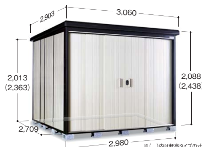
※( )内は軒高タイプの寸法です ※写真は軒高タイプです