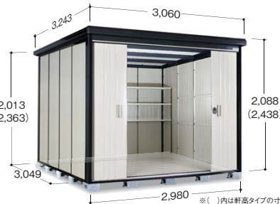
※( )内は軒高タイプの寸法です ※写真は軒高タイプです