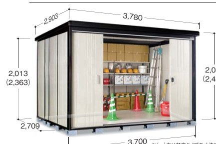
※( )内は軒高タイプの寸法です ※写真は軒高タイプです

●扉有効寸法 2,002mm×2,157mm ●室内有効寸法 3,642mm×1,130mm×2,225mm