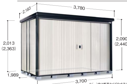
※( )内は軒高タイプの寸法です ※写真は軒高タイプです

●扉有効寸法 2,002mm×2,157mm ●室内有効寸法 3,642mm×1,470mm×2,236mm