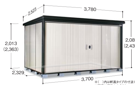
※( )内は軒高タイプの寸法です ※写真は標準タイプです

●扉有効寸法 2,002mm×2,157mm ●室内有効寸法 3,642mm×750mm×2,263mm