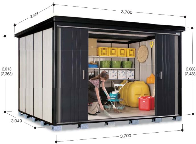
※( )内は軒高タイプの寸法です ※写真は軒高タイプです

標準タイプ 坪数 3.42坪(11.28㎡) KMR-3730 重量 552kg