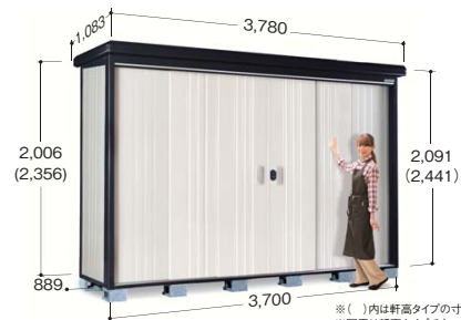
※( )内は軒高タイプの寸法です ※写真は軒高タイプです

●扉有効寸法 2,002mm×2,157mm ●室内有効寸法 3,642mm×1,850mm×2,230mm