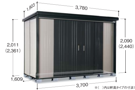
※( )内は軒高タイプの寸法です ※写真は軒高タイプです

●扉有効寸法 2,002mm×2,157mm ●室内有効寸法 3,642mm×2,910mm×2,220mm